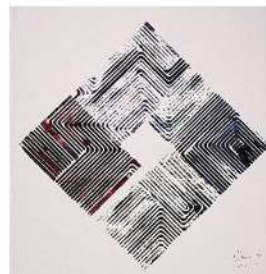
FLOW L13 LxH 50x50, 2025., tinta i akril na papiru