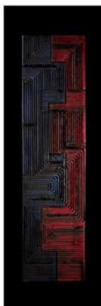
FLOW L05 LxH 120x30, 2024., jasen plavo i crveno bajcan