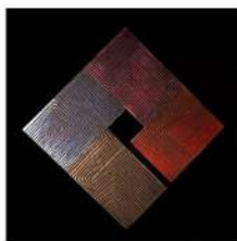
FLOW L13 LxH 85x85, 2024., jasen plavo, ljubičasto, crno i crveno bajcan