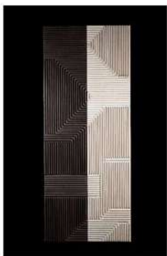
FLOW L08 LxH 100x40, 2024., jasen crno i bijelo bajcan