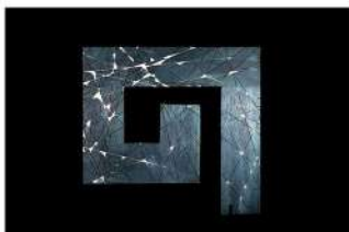
FLOW A18 LxH 100x70, 2024., plavo bajcan