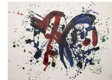
ART 1-103 LxH 70x50, 2025., tinta i akril na papiru