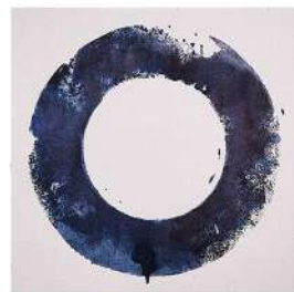
ZEN X LxH 50x50, 2025., tinta i akril na papiru