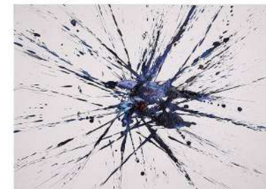
ART 1-101 LxH 70x50, 2025., tinta i akril na papiru