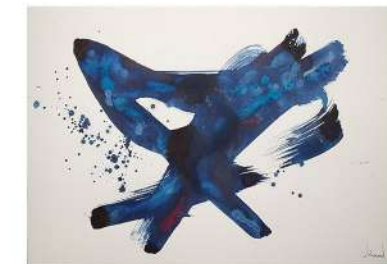
ART 1-102 LxH 70x50, 2025., tinta i akril na papiru